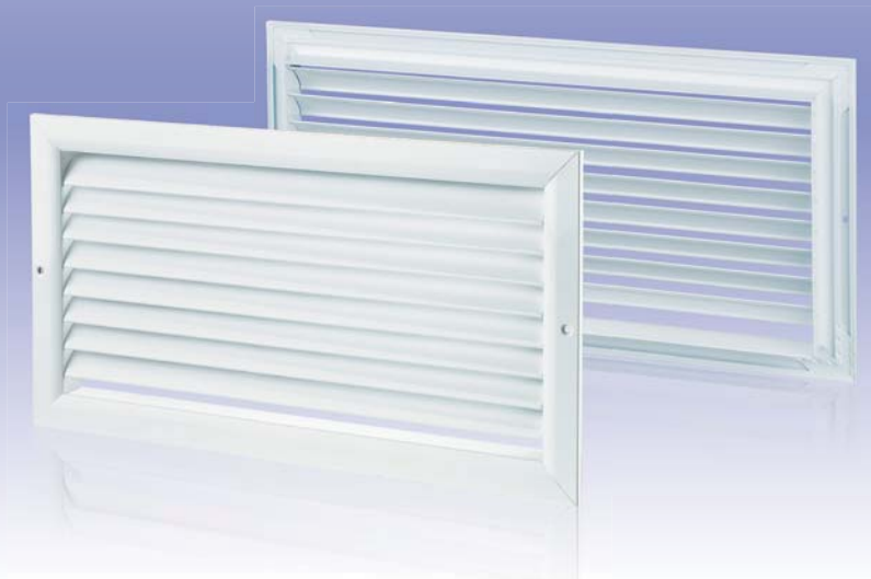
Single-row horizontal ventilation grille with fixed vanes