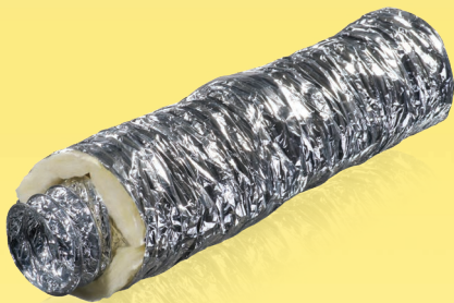
605-Iso M0 605-Iso M1

Flexible wärmeisolierte Lüftungsrohre aus Aluminiumfolie