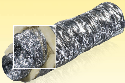
605-Sono M0 605-Sono M1

Flexible wärmeisolierte Lüftungsrohre aus Aluminiumfolie