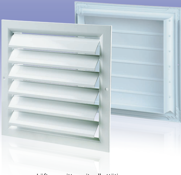
Lüftungsgitter mit selbsttätigen Verschlussklappen