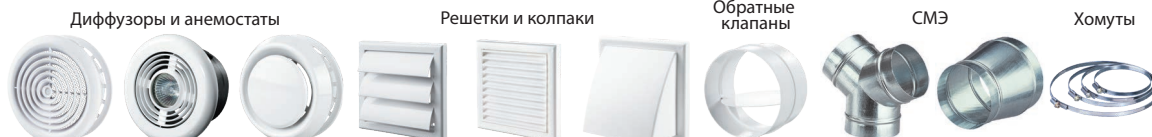
Диффузоры и анемостаты