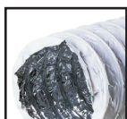
Белый ( )