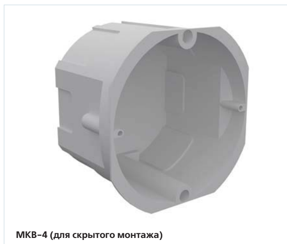
МКВ-4 (для скрытого монтажа)