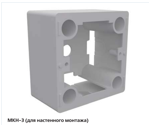
МКН-3 (для настенного монтажа)