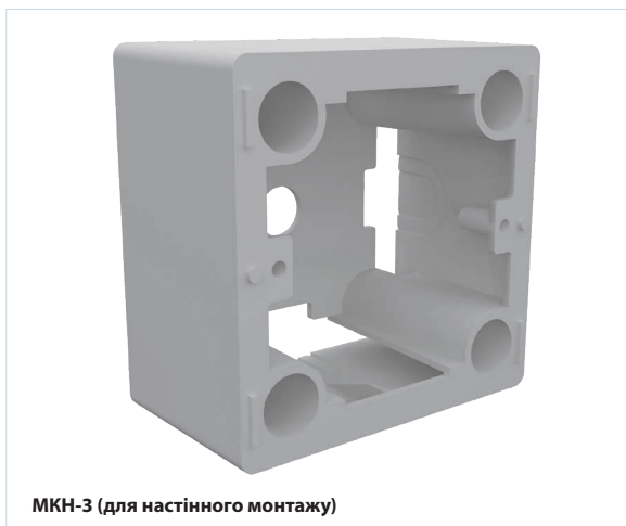
МКН-3 (для настінного монтажу)