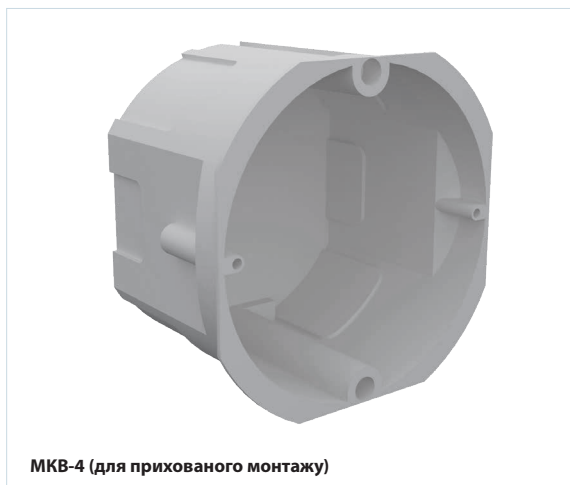
МКВ-4 (для прихованого монтажу)