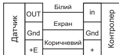
Схема електричного підключення