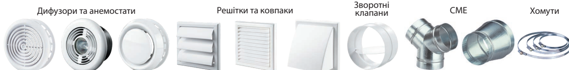
Дифузори та анемостати