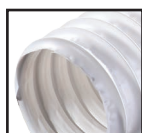
Білий ( )