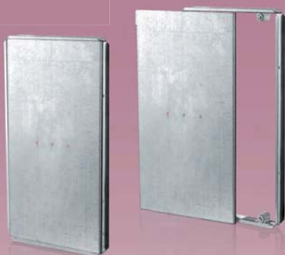
Ревізійні дверцята на металевій рамі для кріплення керамічної плитки