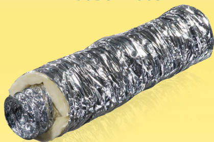
605-Изо M0 605-Изо M1

Гибкие теплоизолированные воздуховоды из алюминиевой фольги