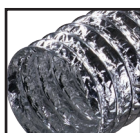
Алюминиевый ( )