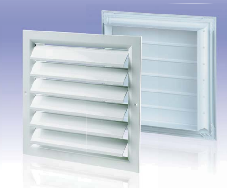
Вентиляционная решетка с гравитационными жалюзи