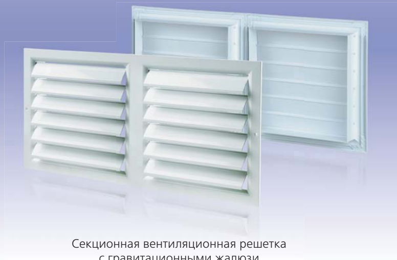
Секционная вентиляционная решетка с гравитационными жалюзи