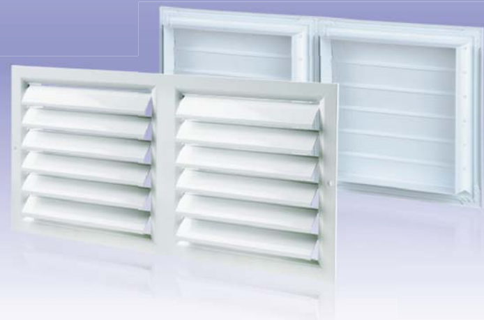
Секційна вентиляційна решітка з гравітаційними жалюзі